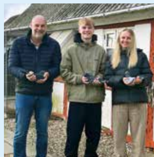
Team Bang, DAN 013 Svendborg Vinder af DM Marathon