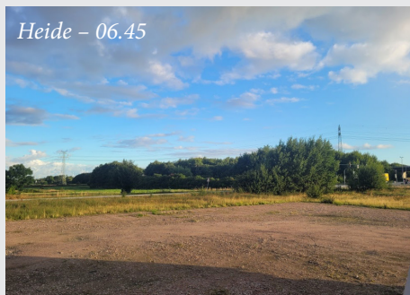
Heide - 06.45