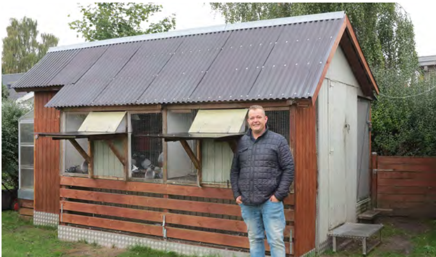
Slagstørrelsen er nødvendigvis ikke afgørende!