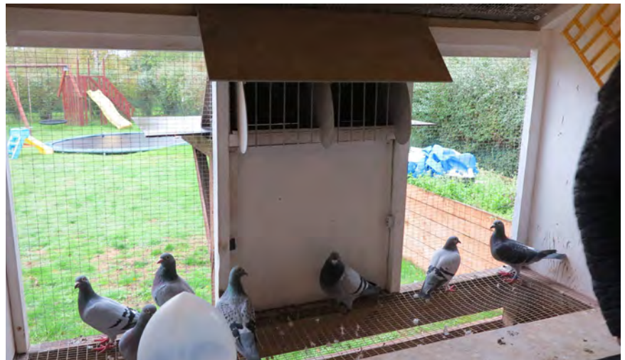
Et kig ud af slaget fra enkehannernes afdeling - bemærk det rigelige luftindtag fra fronten via trådnettet

I april 2014 avlede Brian på to duer fra Ruud hannen 4049. Faderen til 4049 var efter topduen "Blue Eagle 1" med 14 placeringer af 14 mulige på overnatningsflyvninger. Moderen til 840 var efter "840", som brilierede med 11 placeringer af 11 mulige på overnatningsflyvninger, så de genetiske forudsætninger for 4049 til at klare