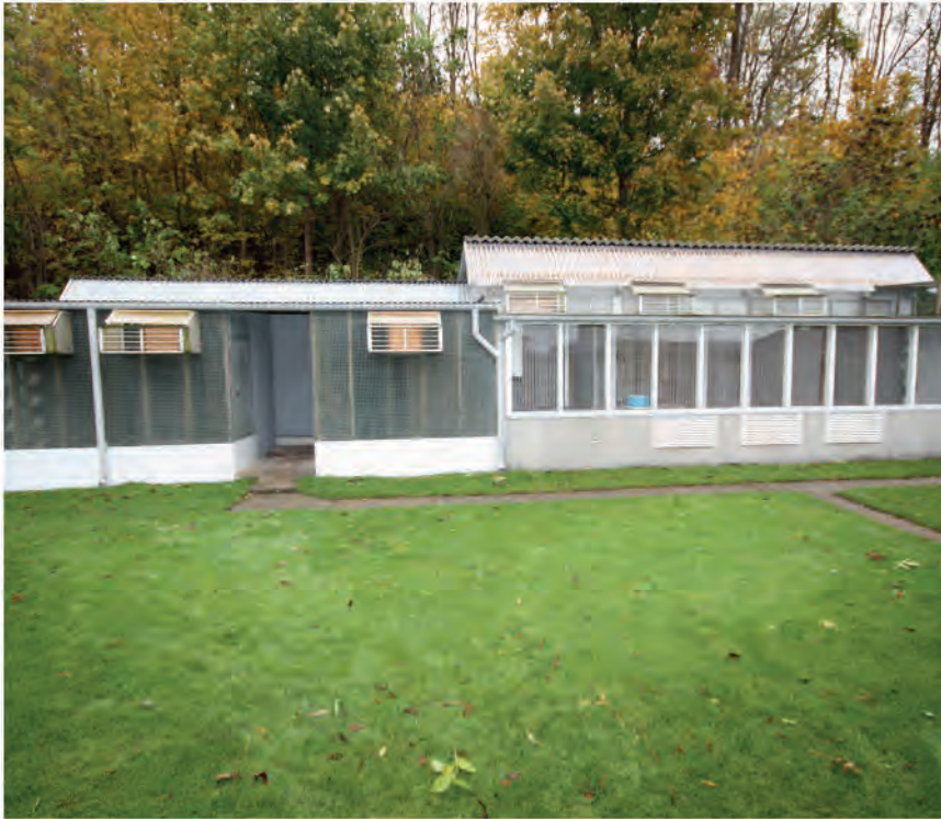
Team Pedersens slag

Ud over Master Black bliver der brugt lidt småfrø og afskallet solsikke om aftenen.