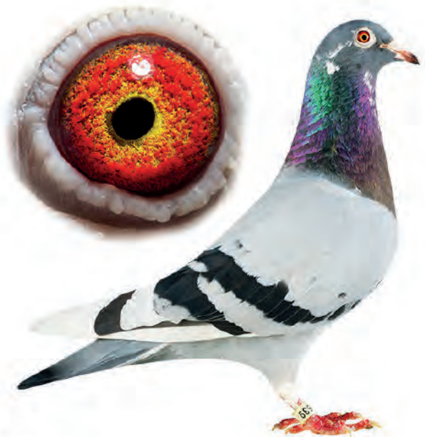
Stampar 2 - 023-12-0529 x 070-12-0539 har ligeledes været et kanonpar for Team Pedersen.

Den seneste sæson har også vist at børn af de 2 stamper har gode avlsegenskaber - et godt eksempel: