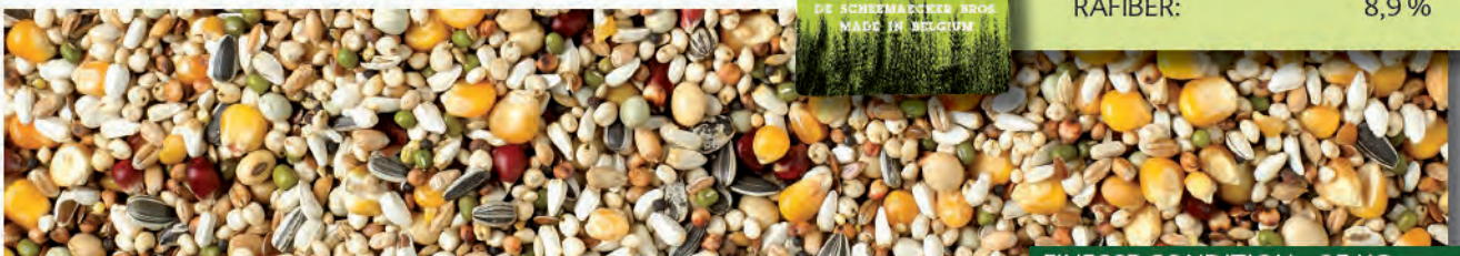
FINESSE CONDITION - 25 KG

NATURAL BRANDE A/S – GL. KÆRVEJ 17 – 7330 BRANDE – WWW.NATURAL-BRANDE.DK