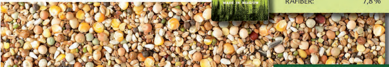
FINESSE START - 25 KG

NATURAL BRANDE A/S – GL. KÆRVEJ 17 – 7330 BRANDE – WWW.NATURAL-BRANDE.DK Tel.: 97 18 70 40 – E-MAIL: NATURAL@NATURAL-BRANDE.DK