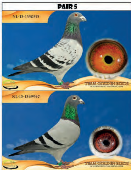
PAR 5: Forældre til mange topduer & 2 sektionsvindere.