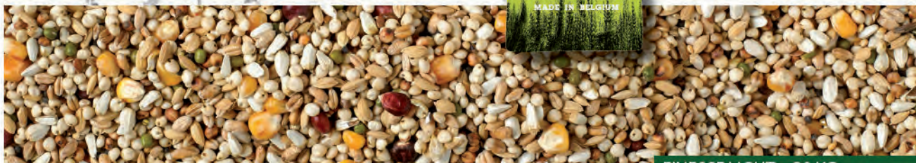
FINESSE LIGHT - 20 KG

NATURAL BRANDE A/S – GL. KÆRVEJ 17 – 7330 BRANDE – WWW.NATURAL-BRANDE.DK Tel.: 97 18 70 40 – E-MAIL: NATURAL@NATURAL-BRANDE.DK