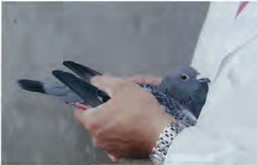
Langdistanceopdrættere sorterer ikke deres unger på basis af præstationer, men i hånden. Og det er oftest som at spå i kaffegrums.

ikke med vinterunger falder succesen ned fra himlen.