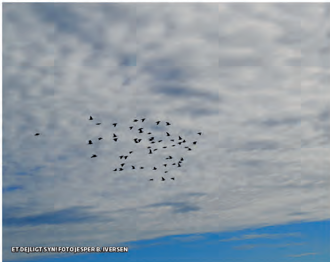
ET DEJLIGT SYN!

Ja, tre utrolige historier fra det virkelige liv.