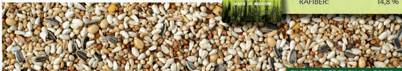
FINESSE ENERGY PLUS – 20 KG

NATURAL BRANDE A/S – GL. KÆRVEJ 17 – 7330 BRANDE – WWW.NATURAL-BRANDE.DK Tel.: 97 18 70 40 – E-MAIL: NATURAL@NATURAL-BRANDE.DK