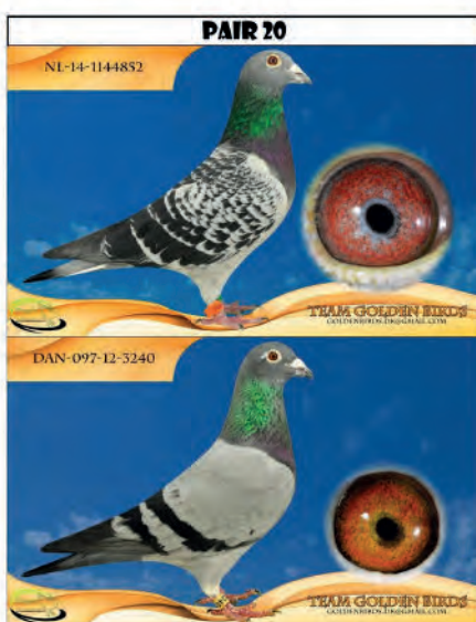
PAR 20: Forældre til 5813-5814-5856, som til sammen havde 3 andele i langflyvemesterskabet sport 2017.

053-15-5813 var sektionsvinder fra Antwerpen & 2 & 3 bedste es-due på langdistance i region/sektion.