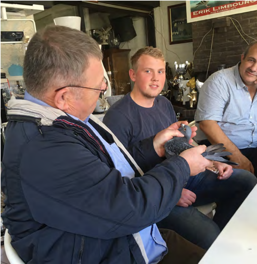
Bent sidder med 6. hurtigst due national fra Barcelona 2017

interesse i duerne. Den var dog ikke så stor, men det lykkedes at få hende til at håndtere enkelte af duerne.