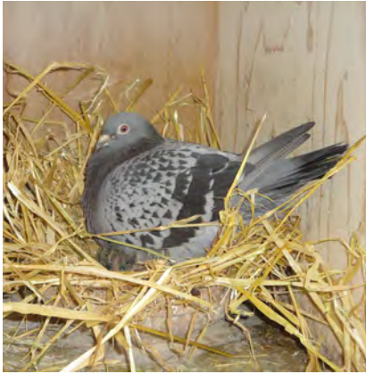
111-15-239U Plac: 20171-3-3-4-12-14-17-58-83

førte selv resultater og spil op i en bog. Denne bog fandt jeg efter hans død. Her så jeg en side, hvor han gør spillet op. Han havde spillet for 248 kr. og vundet 680 kr.