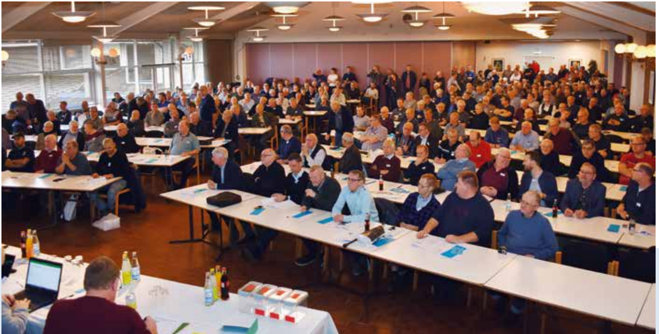
Repræsentantskabsmødets deltagere og tilhørere

Hovedbestyrelsens vurdering taget alle skyldige hensyn til organisationens forpligtelser. For øjeblikket varetages samtlige arbejdsopgaver i De danske Brevdueforeningers administration af frivillige og ulønnede personer, og der er endnu ikke ansat en ny medarbejder. Forretningsførerens løn udbetales løbende i opsigelsesperioden, og denne løn bogføres i takt med udbetalingerne frem mod fratrædelsesdatoen.