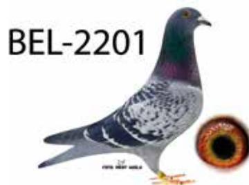
Klasse 7 - 901-24-2201 - T.N. Racing - 220 Odense - 93,75 point