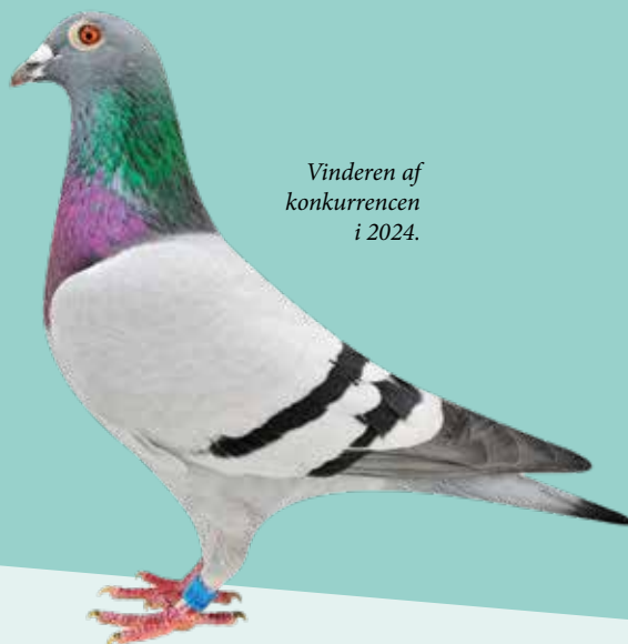
Vinderen af konkurrencen i 2024.