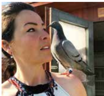
Fortrolighed mellem ejer og duer