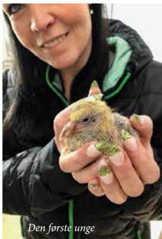
Den første unge