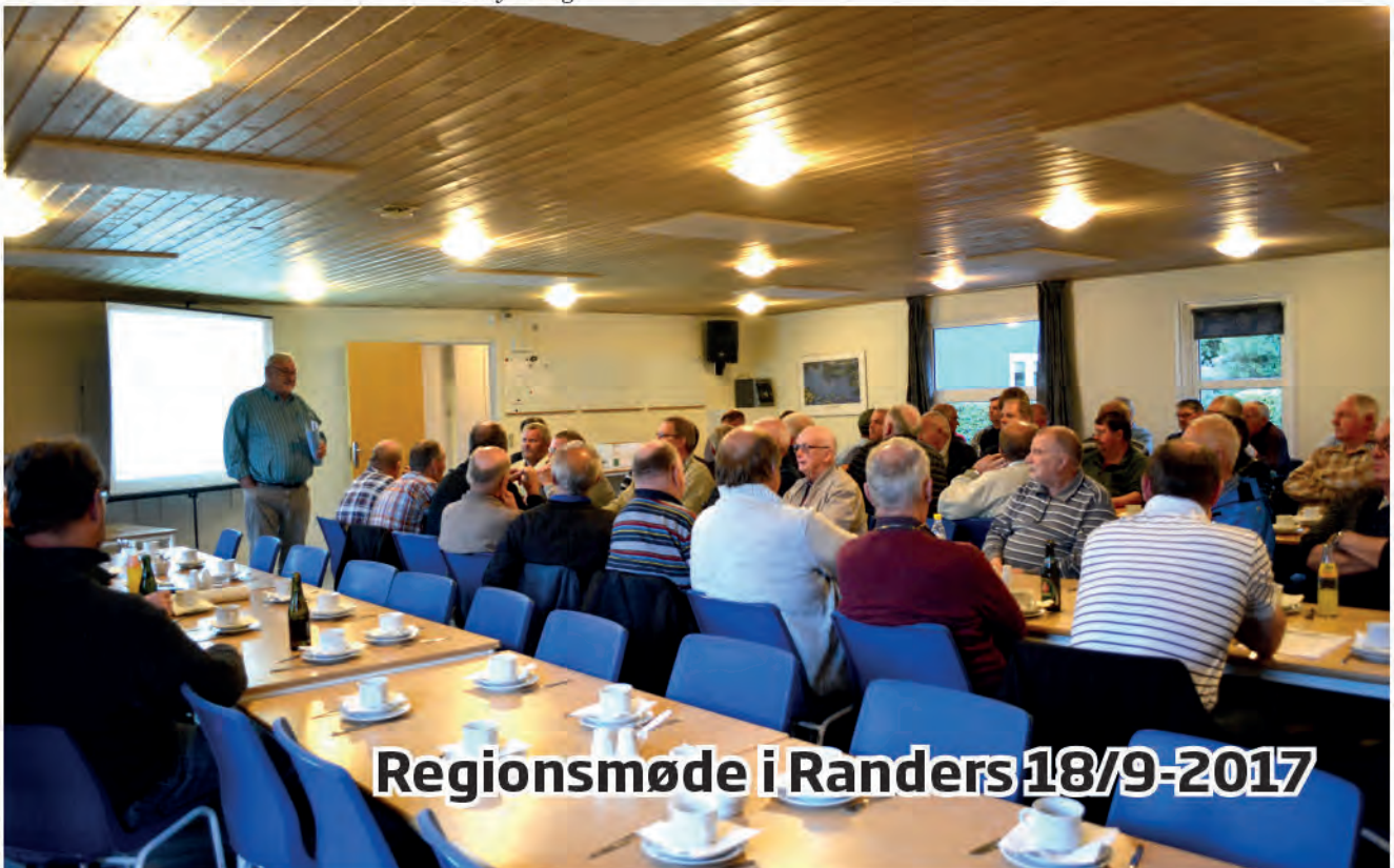
Regionsmøde i Randers 18/9-2017

Jeg anser det også for ekstremt vigtigt at fodre meget, genopbygge reserverne og træne. I sidste ende er det en lukket kreds. Duer, der kan lide at spise, opbygger reserver og motionerer gerne. Giv lidt knappere foder på kortdistancen, men har de ikke nok reserver til mellemlang eller langdistancen, hvor der skal arbejdes mere, får man sig en alvorlig skuffelse. Jeg håber, du får gavn af mit svar og letter din søgning efter et fodringssystem. Husk, at du aldrig kan give for meget, men kun give for lidt. ■