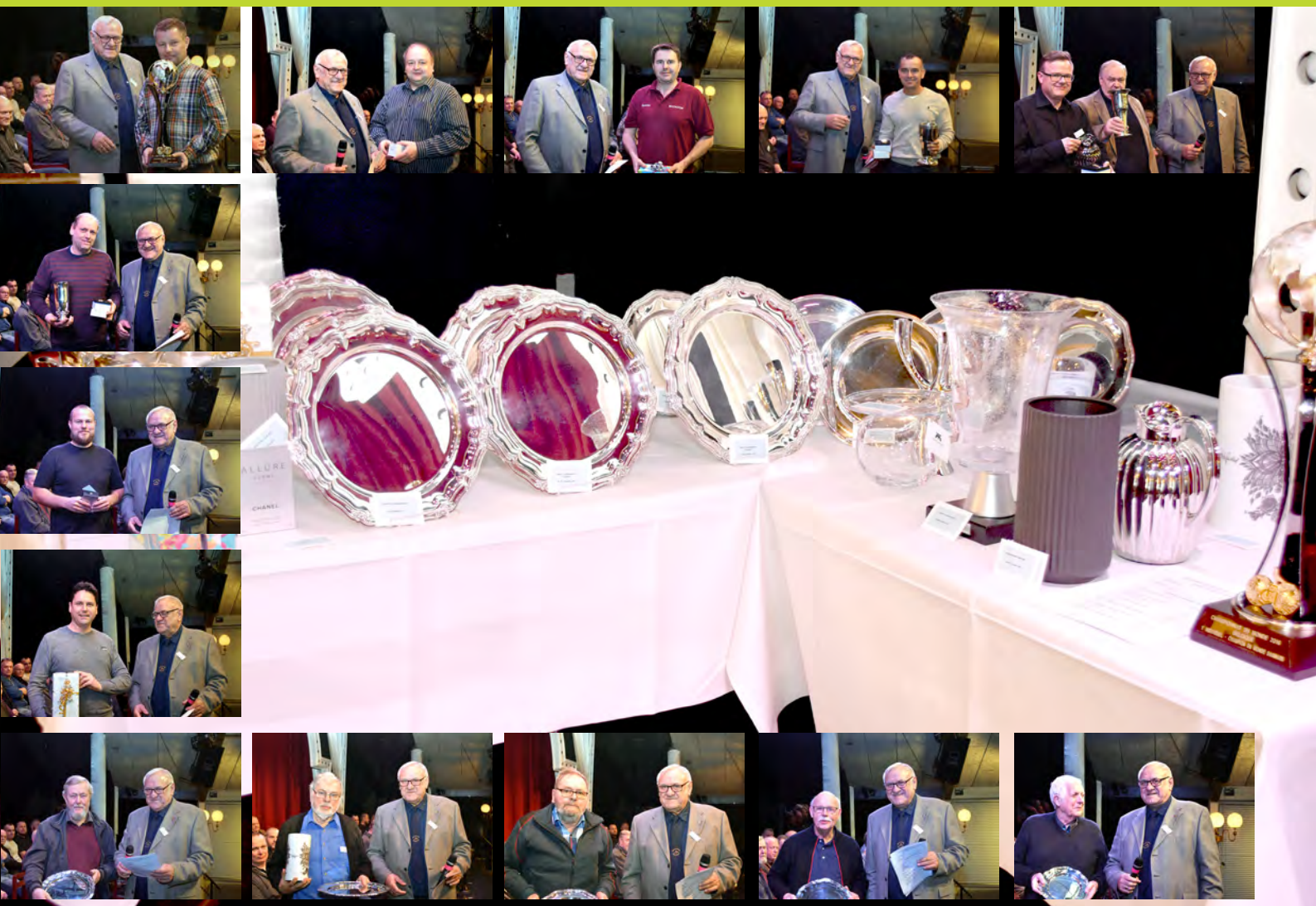
Præmiebord og nogle af præmievinderne 2017