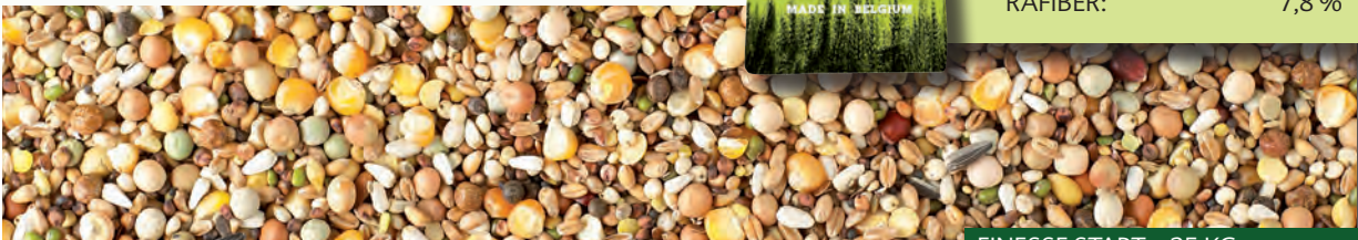
FINESSE START - 25 KG

NATURAL BRANDE A/S – GL. KÆRVEJ 17 – 7330 BRANDE – WWW.NATURAL-BRANDE.DK Tel.: 97 18 70 40 – E-MAIL: NATURAL@NATURAL-BRANDE.DK