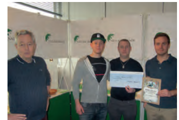
Age & Sønner, 087 Helsingør