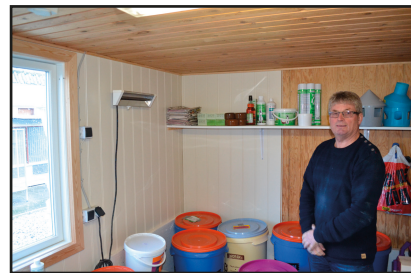
Tør opbevaring af korn og biprodukter

Første uge i marts parres alle flyveduerne. Har tidligere parret duerne midt i februar, men da fælder de for tidligt og hurtigt. Flyveduerne opfostrer kun én unge, da Steinar ikke skal bruge så mange unger fra flyveduerne. De unger, som skal bruges, deles rundt, så alle par har en unge i reden. Flyveduerne er ikke ude fra oktober til marts. De første gange flyver de ikke så lang tid. Efter en uge flyver de en