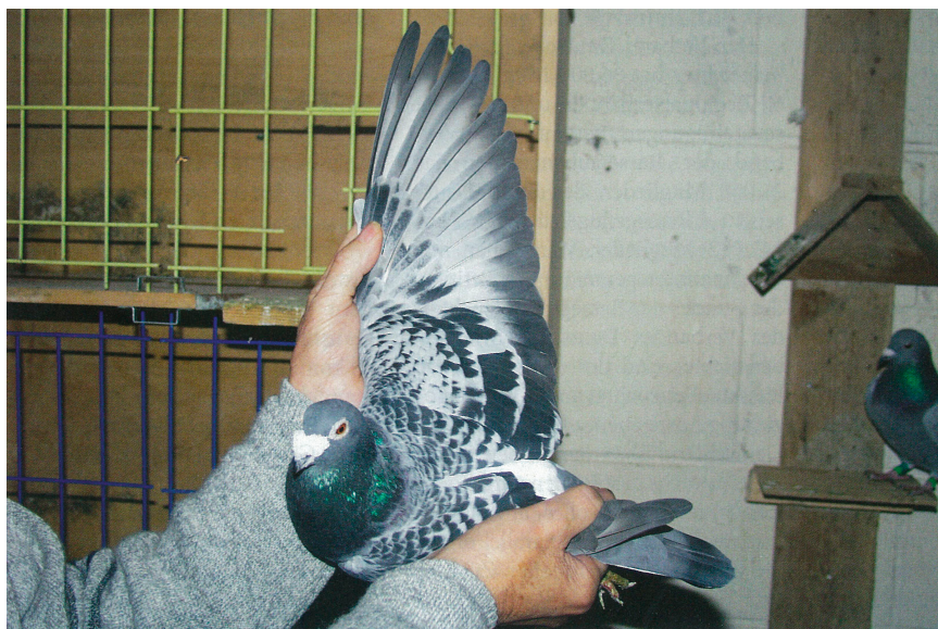
„Undtagelser bekræfter reglen, men virkelig gode avlsduer er altid også pragteksemplarer i hånden.“

I samtaler eller diskussioner om duesporten, bliver jeg nogle gange selv af venner bebrejdet, at jeg træffer hurtig-