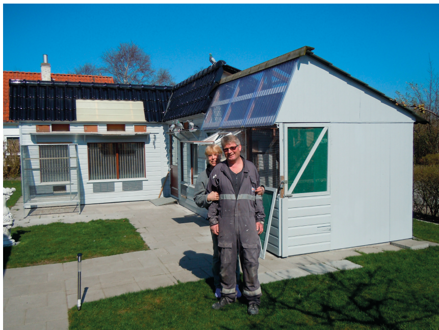
Også kærlighed til brevduesporten

De første unger, født i Norge, blev installeret og vænnet til slaget og kapflø-