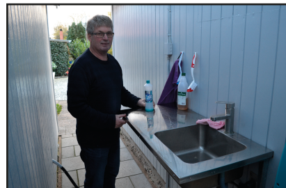
Rengøring af vand og fodertrug

time uden besvær og pause, så det går hurtigt med at genoptræne formen. Steinar er ikke nervøs over, at duerne er indespærret over lang tid. I løbet af et par uger er duerne i det høje gear og herefter flages der. Flagningen gør, at duerne ved, at det er alvor og at de skal bestille noget, når de er ude. Så snart flaget fjernes, åbnes indgangen og Steinar fløjter hans gode venner ned og ind. Ved regnvejr kommer de ikke ud, da det slår formen tilbage. Når vejret er godt, begynder han de korte træningsture. Træningsturene intensiveres op til de første sektionsflyvninger. Gennem sæsonen trænes duerne hver tirsdag for at holde dem i gang. Flyveduerne får ind imellem enkeltslip fra Lendum og ØsterVrå. Hvis humøret skulle være væk, køres der også en kort tur om mandagen, hvilket kun sker en eller to gange i en sæson. Ang. motivation af flyveduerne, hvor mange ting er afprøvet, fortæller han, at hunnerne altid vises til hannerne, da de bliver meget mere rolige i kurven. Hunnerne er derimod vanskeligere at motivere, siger han. I 2016 vil Steinar lave et forsøg med "opretholdelse af dagslyslængden" i de sidste 3 - 4 uger af sæsonen, hvor det bliver tidligere mørkt efter Sankt Hans. Det betyder, at han vil tænde lyset på slaget fra kl. 21.00 - 23.15. Det gøres, for at undgå, at duerne smider mange krops og slagfjer i uge 30 - 32. Forplejning af flyveduerne Steinar har et godt opvarmet rum til