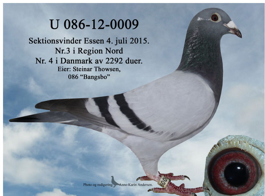
Superduen nr. 9

Steinar bruger en god støvmaske med gode filtre og en heldragt. Brevduemandens helbred er også vigtigt. Her er hovedrengøring en og god og billig forsikring til at undgå duststøv i lungerne. Så den grundige rengøring er til gavn både for duerne og brevduemanden. Alt inventar bliver fjernet fra slaget. Også duerne. Først bliver der støvsuget over alt. Herefter blæses alt rent. Der er mange "krinkelkroge"