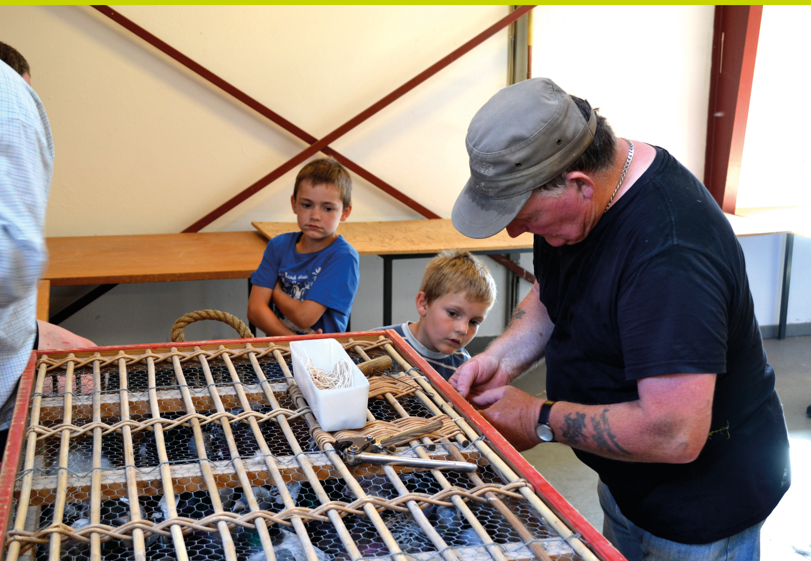
Ungdommelig nysgerrighed.