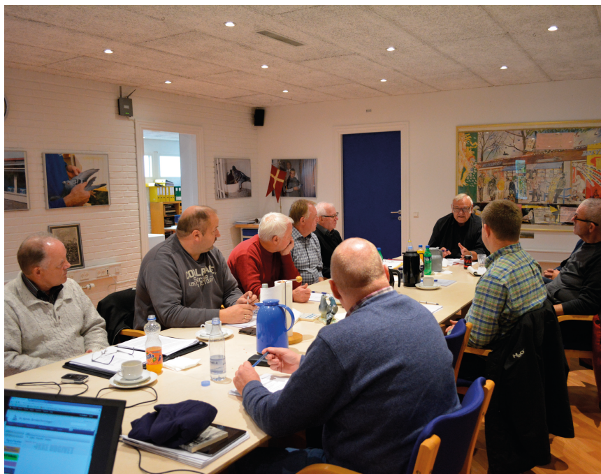
Hovedbestyrelsen samlet for at forberede det kommende repræsentantskabmøde den 6. februar 2016