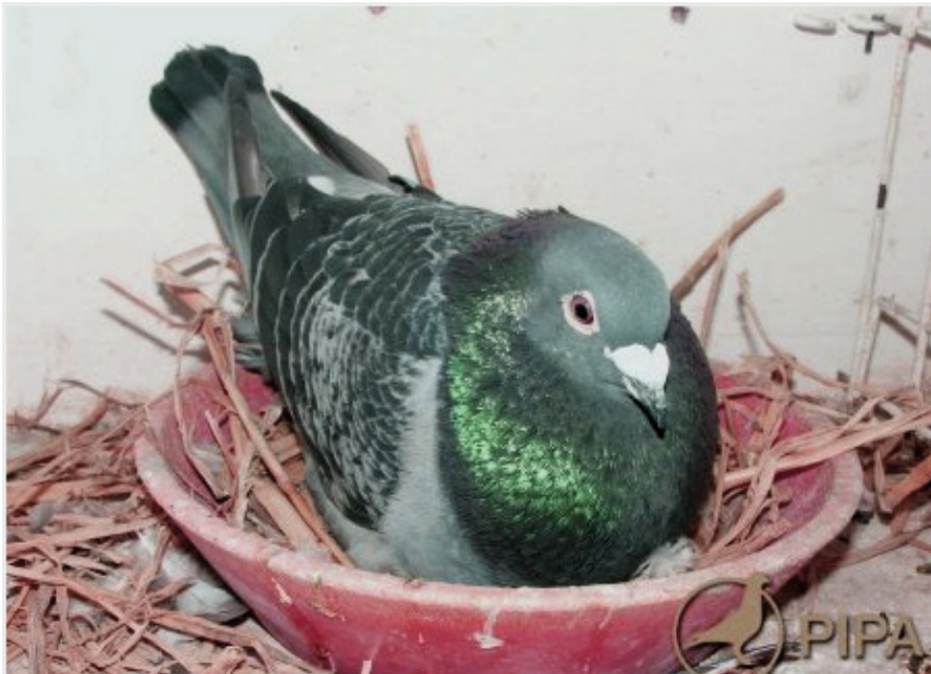
Der arbejdes på næste generation.

krydsede jeg flittigt ind på min familie, og fik på et tidspunkt "Sister Good Yearling". Hun var desværre ingen god kapflyver eller avler, lige indtil jeg gav hende en ny partner af en helt anden blodlinje, og en unge af dette par vandt National Orlean 1 pris (1985). Moderen var desværre blevet noget ældre da jeg opdagede hendes værdi som avler. Det sker desværre ofte, at en god avler bliver dræbt, solgt eller bliver for gammel.