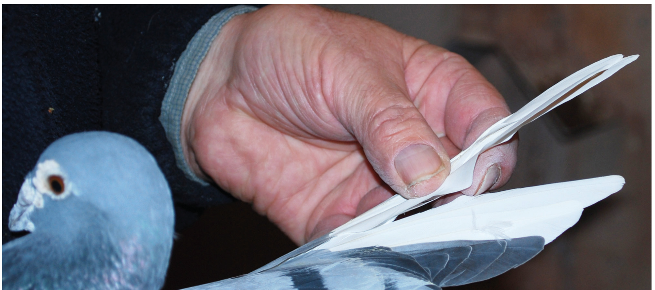
Kontrol af fleksibiliteten af de yderste slagfjer. Ved testen bøjes de yderste slagfjer forsigtigt mellem tommel og pegefinger

Breduefolk i det østlige Asien og Amerika, vil helst avle deres duer i familier, og deraf følger der indavl. Dette er en udmærket ide, forudsat at afkommet skal bruges til avl og ikke til kapflyvning. Næsten alle topduer i Holland/Belgien, er kommet fra blodlinjer der krydses. I 1980'erne havde jeg min "Good Yearling", og duer i familie til denne due. Jeg ønskede at holde denne familie ren, og jeg avlede da også gode duer af og til. Jeg opdagede imidlertid, at de sportsfæller der købte unger af "Good Yearling" familien, havde bedre resultater med avlen af disse duer end jeg. De der købte mine unger krydsede dem ind på deres egne duer med godt resultat. Fra da af