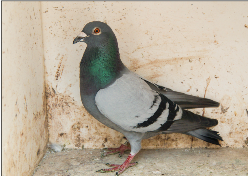
DAN 232-12-397 - Regionsvinder Soltau 2.325 duer