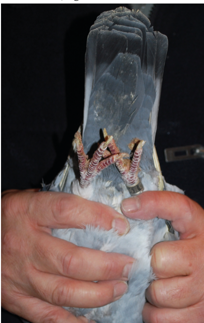
Kontrol af benbygning: Med pegefingern på gaflerne og to fingre bagest på brystbenet, laves et let tryk på benbygningen.

Er brevuefolket på indkøb efter nyt avlsmateriale, er historien mange gange den samme: De ønsker at købe f.ex. 6 duer, og dette skal være 3 han-