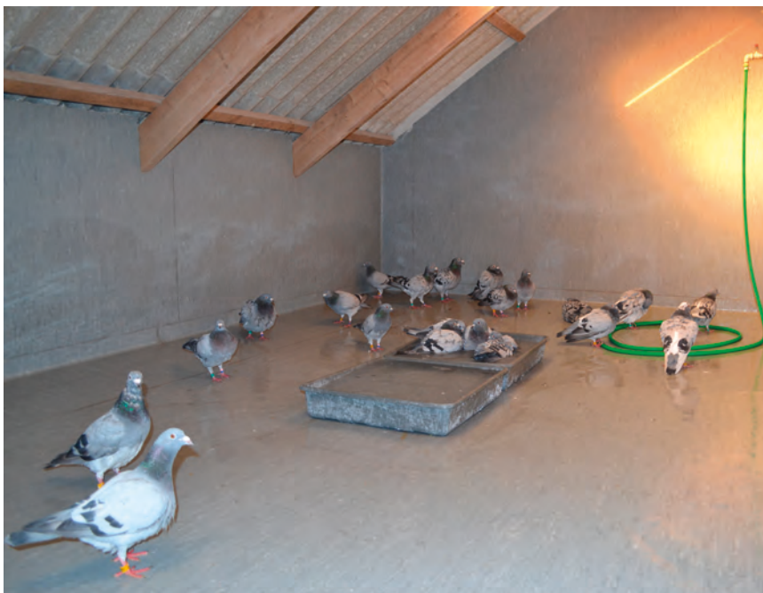
Duerne får deres ugentlige bad godt beskyttet mod rovfugleangreb

BEL 13-6300512 Christian Lund Andersen 8643 Ans By Tlf: 2231 8355