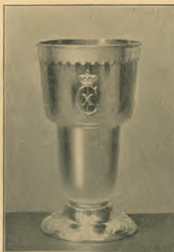
H. M. Kongens Vandrepræmie.

Hans Majestæt Kongens Vandrepræmie og Generalstabens Ærespræmie.