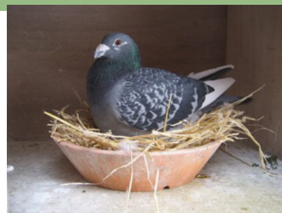
Snart kläcks nästa generation

Vad vet vi egentligen om duvors upplevelser och känslor i allmänhet? Hur reagerar duvan när vi tar den i red-