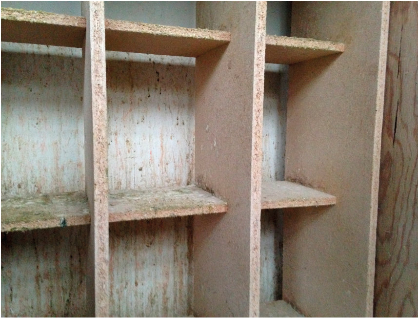
Enkehunnernes sidde reoler