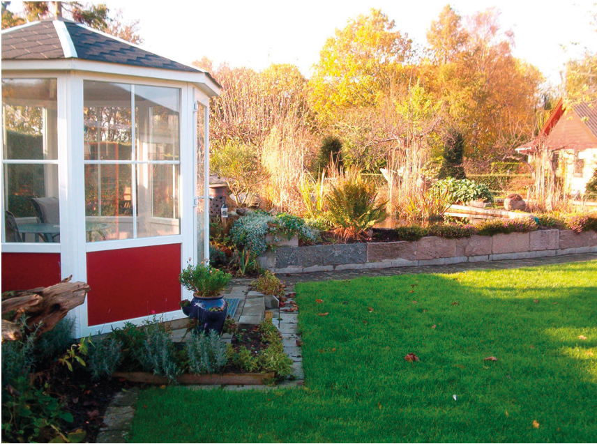
Ventesal med udsyn

ligt, at jeg aldrig fik talt med ham, som boede 500 m fra min morfar. Det havde ændret min barndom - måske mit liv totalt.