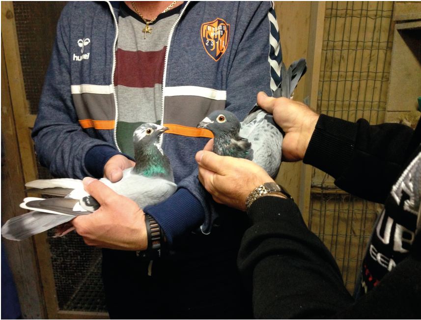
Forældre til "Blue Final" - moderen til venstre og faderen til højre