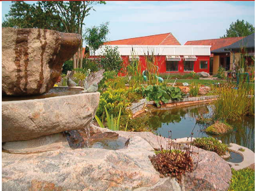
Haven med flyveslaget

Min morfar boede i Brønshøj i København og havde 4-8 duer i et lille loftsslag. Der var flere loftsslag rundt i