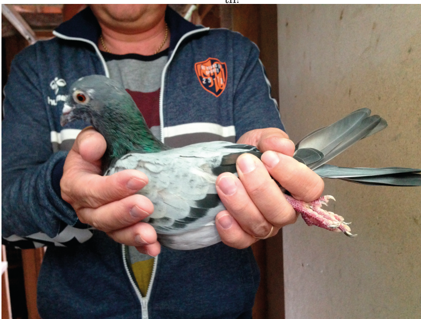
Nærbillede af "Blue Final"