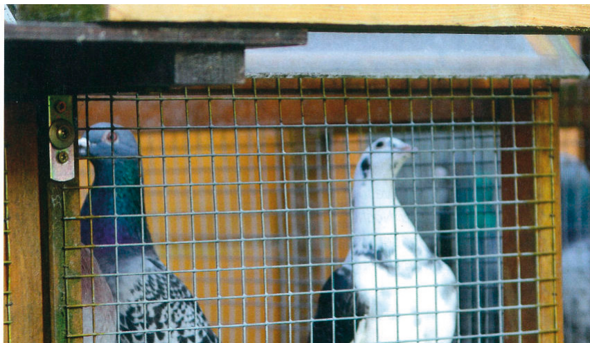
Et opmærksomt kig op på himlen. Duernes genkendelse af rovfugle og den heraf følgende risiko er medfødt.

Nogle gange læser man, at en opdrætter har konstateret, at det ikke gør nogen forskel, om han viser eller ikke viser hannen/hunnen for partneren før den sættes i kurven. Selvfølgelig gør det ingen forskel! Medmindre man