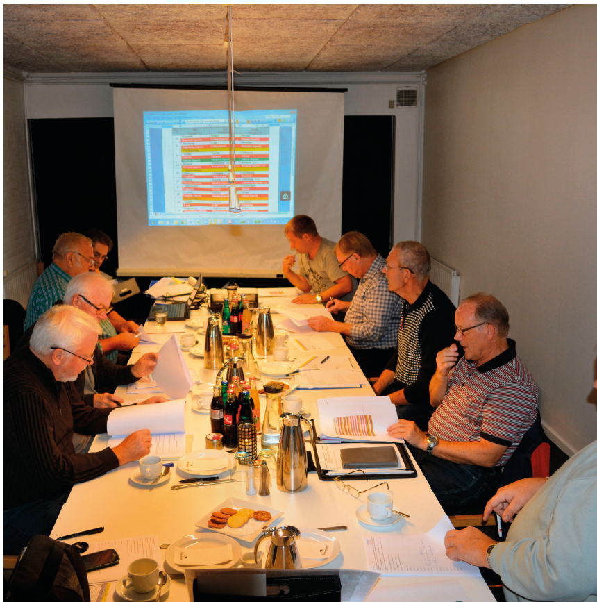
Hovedbestyrelsen samlet for at færdiggøre forslaget til kapflyvningsplanen for 2015 og 2016. Der var mange ønsker at tage stilling til inden planen kunne fremlægges på DdB's hjemmeside.