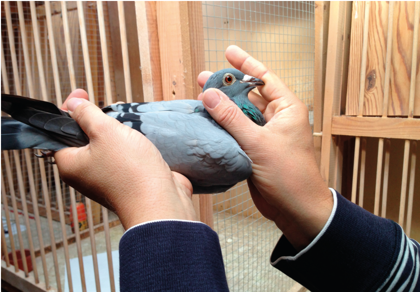
"Pauduivin" vises frem