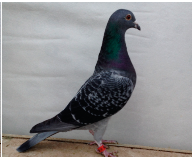
033-11-0935 ES due nr. 4 hunner sektion 11 - 2013