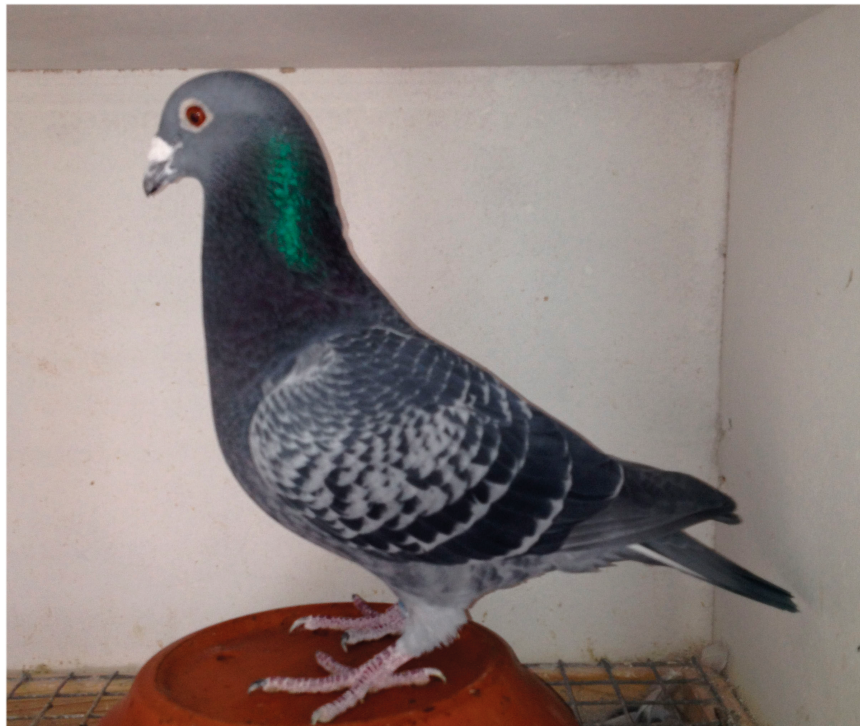
033-10-1244 Superflyver fra nord