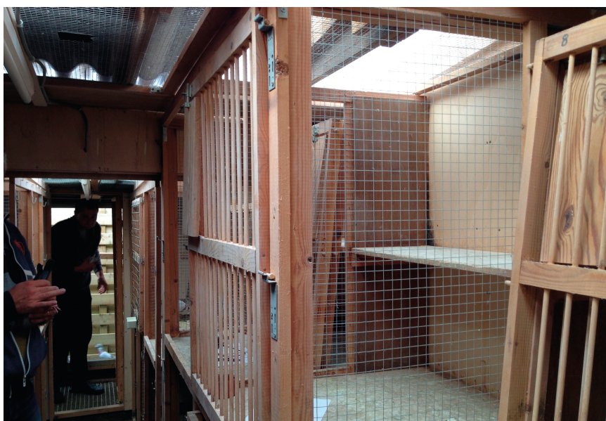
Avlsbokse hos Saeytjdt

Den anden pokal blev vundet fra Perpignan i 2012, hvor hannen "Perpignan" vandt 4. national af 6.724 duer og ligeledes 4. Internationalt af 16.921 duer. "Perpignan" er direkte søn af