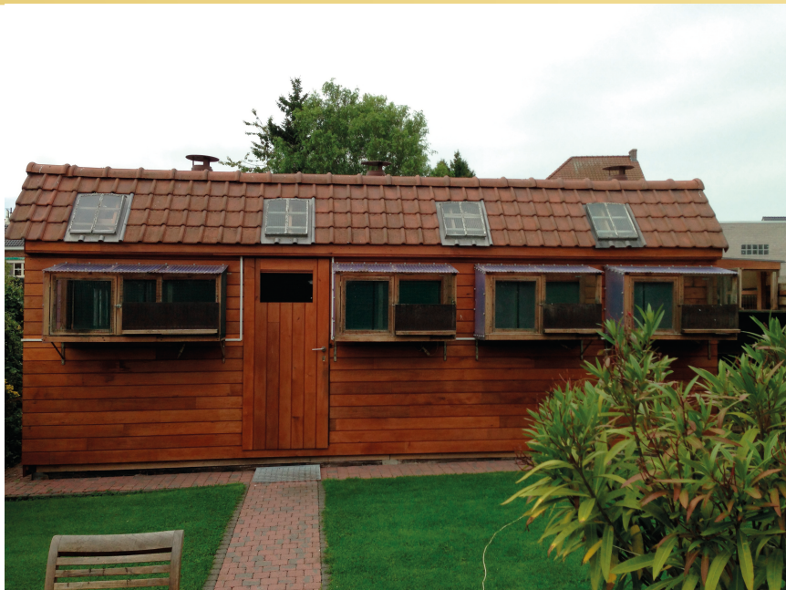
Flyveslag hos Saeytjdt - helt til højre indgang til ungeslag

På et skab i køkkenet pryder to flotte pokaler. Størst er en sølvfarvet pokal formet som en duevinge. Det er pokalen "Zilveren Vleugel", som var vundet fra Barcelona i 2012 på afkrydset due fra Barcelona. Præmien blev vundet af en ægte langflyver – hunnen "Blauwe Barcelona duivin", som blev stemplet hjemme 06.35 lørdag morgen på en afstand over 1.053 km. Hun blev dermed nr. 2 i konkurrencen om den gyldne vinge og samtidig 3. national af 11.706 duer.