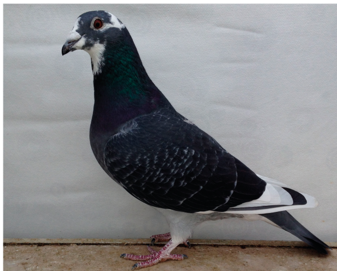
033-12-0077 Sektionsvinder Altona

Som sagt lægges der årligt ca. 60 unger til eget brug og disse trænes en del privat og herefter deltager de i flere træninger med foreningen. ■