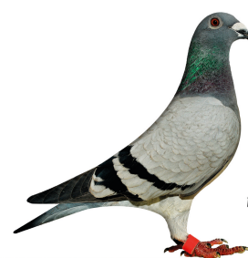
Vinder Klasse 6. 2014

Klasse 4 Jens Kastrup Larsen, 111 Vejen 94,25 point