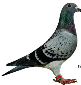
Vinder Klasse 8. 2014