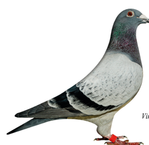
Vinder Klasse 3. 2014

Klasse 1 Lars F. Hansen, 111 Vejen 96,00 point