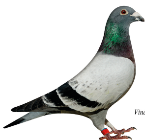
Vinder Klasse 1. 2014