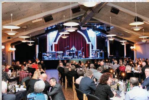
Super underholdning fra scenen