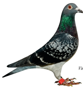
Vinder Klasse 4. 2014

Klasse 3 Benny Jakobsen, 151 Hvalsø 94,50 point