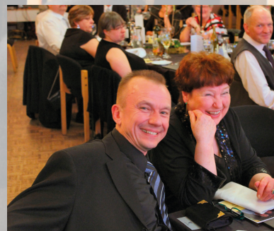
Stemningen er god!