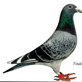
Vinder Klasse 11. 2014