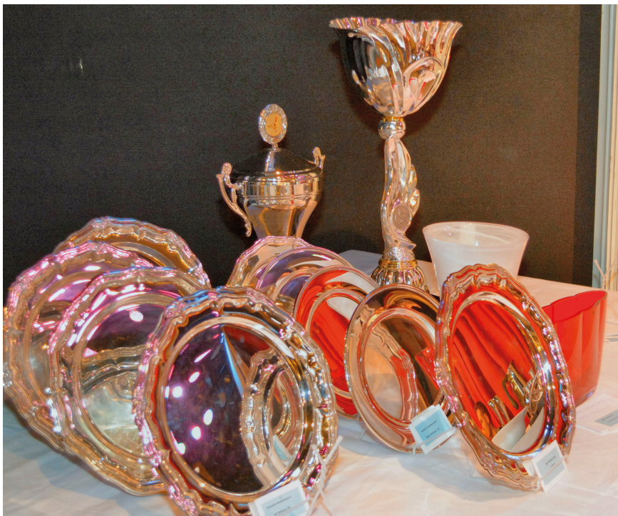
Fra DdB's præmiebord i Brædstrup