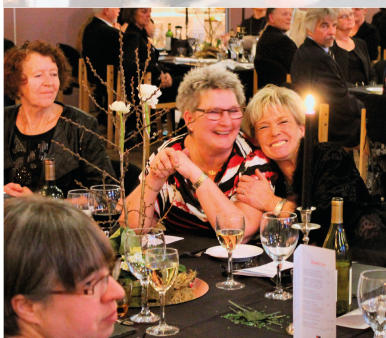
Pigerne hygger sig