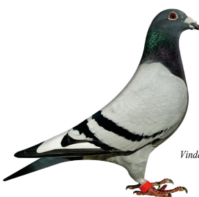
Vinder Klasse 5. 2014