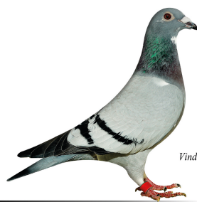
Vinder Klasse 10. 2014

Klasse 9 Tommy Gydesen, 055 Vejle 95.25 point