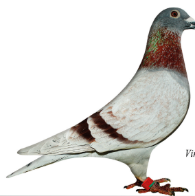
Vinder Klasse 9. 2014

Klasse 7 Casper & Viggo Grossmann, 144 Ribe 94.25 point