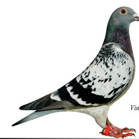
Vinder Klasse 12. 2014

Klasse 10 Jensen - Brakstad, 068 Frederikshavn 94,00 point