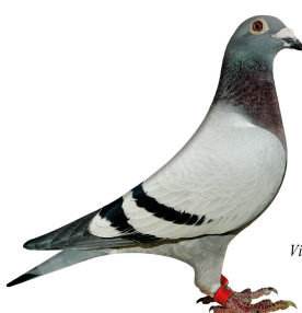
Vinder Klasse 2. 2014