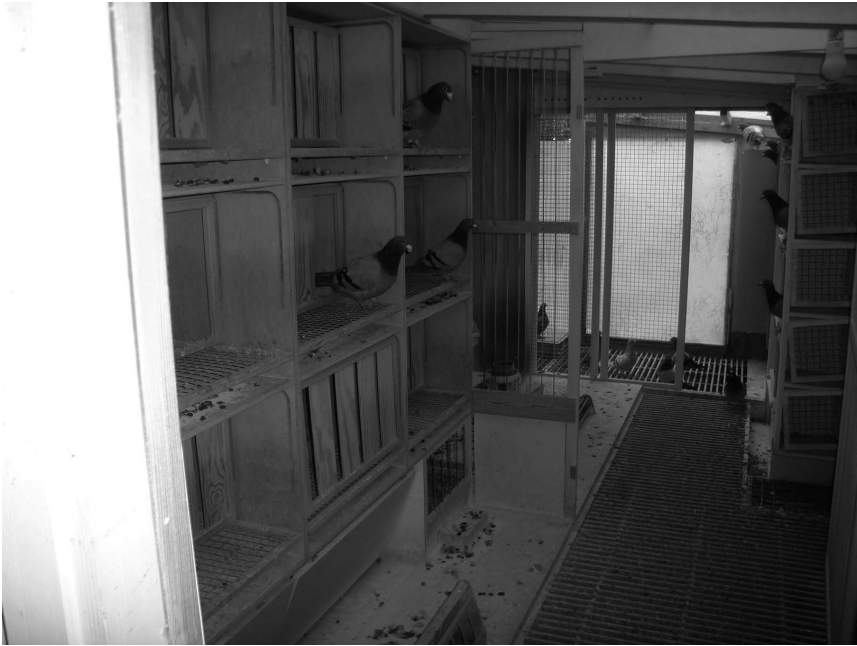
Interiør fra slaget

to generationer. For Jan viser det, med al tydelighed, hvor let vi kan tage fejl.