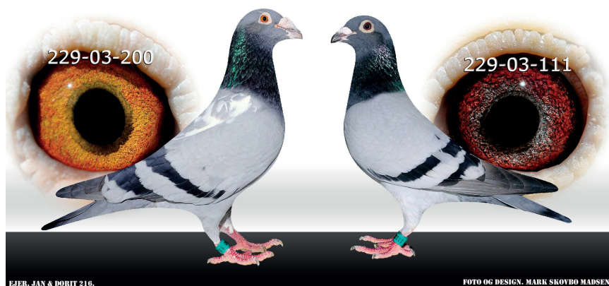
Avlsparret 200/111 og 216-04-391