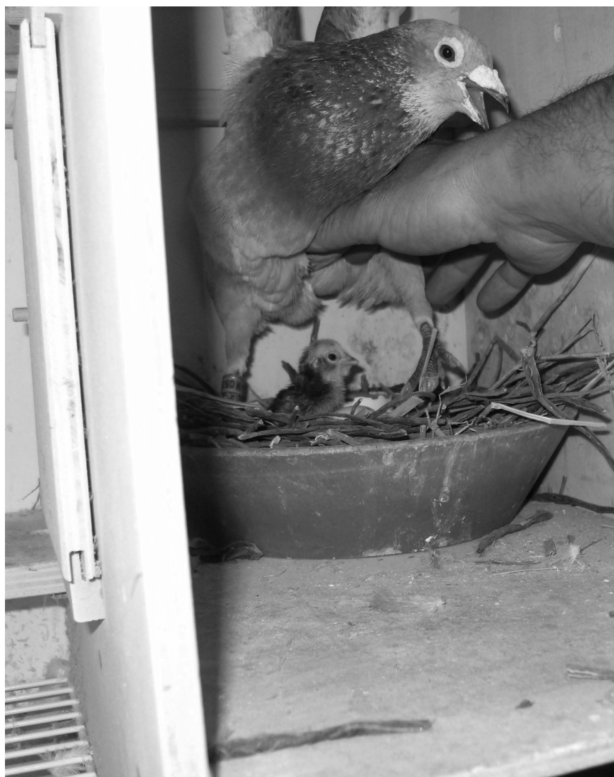
Fatter er gal og måske forvirret! 113