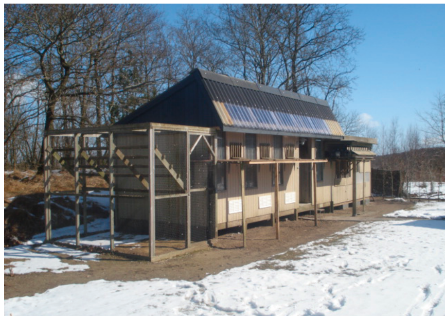
Slaget i vinterlandskab