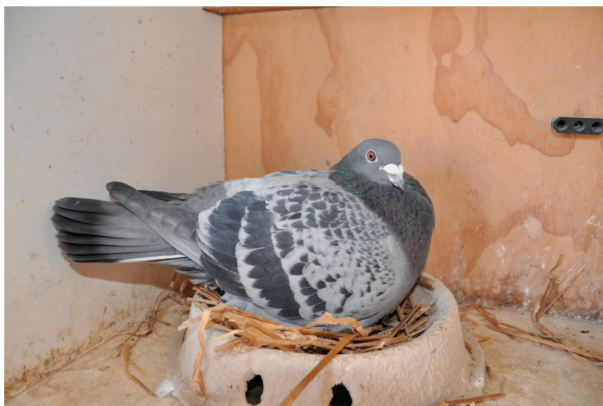
DAN 027-10-0042 Helbror til "Coco". Far til min bedste 1-års hun.