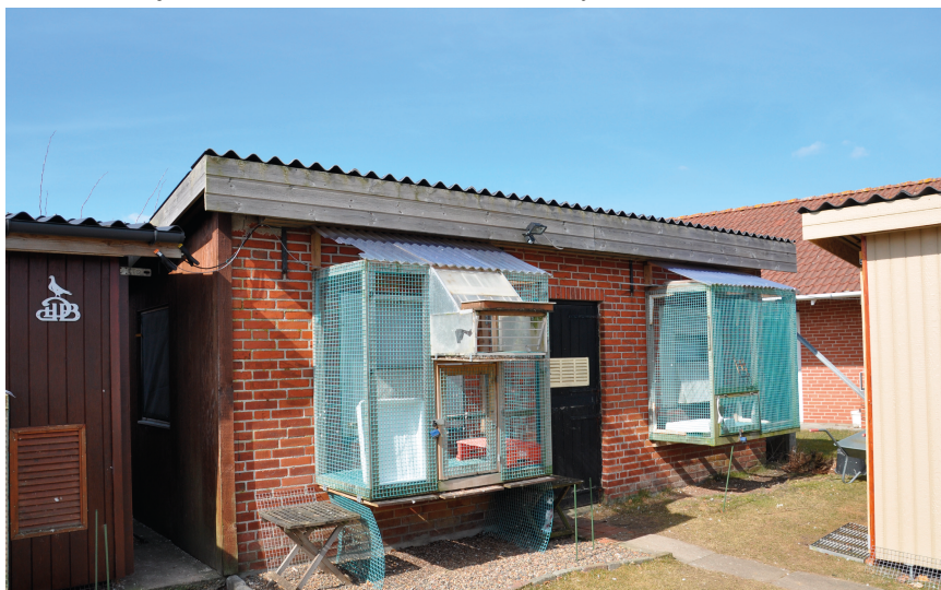
Avsl- og ungeslag