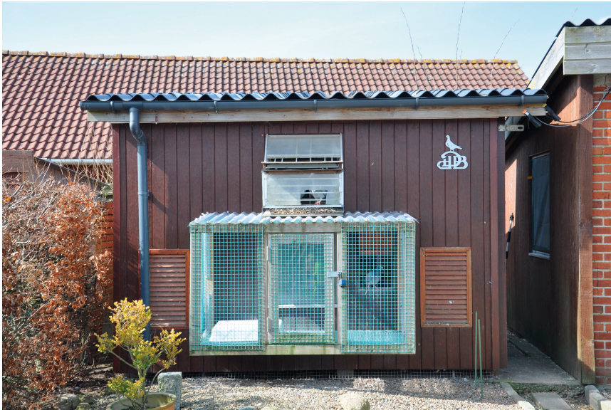
Flyveslaget med plads til 16 par duer