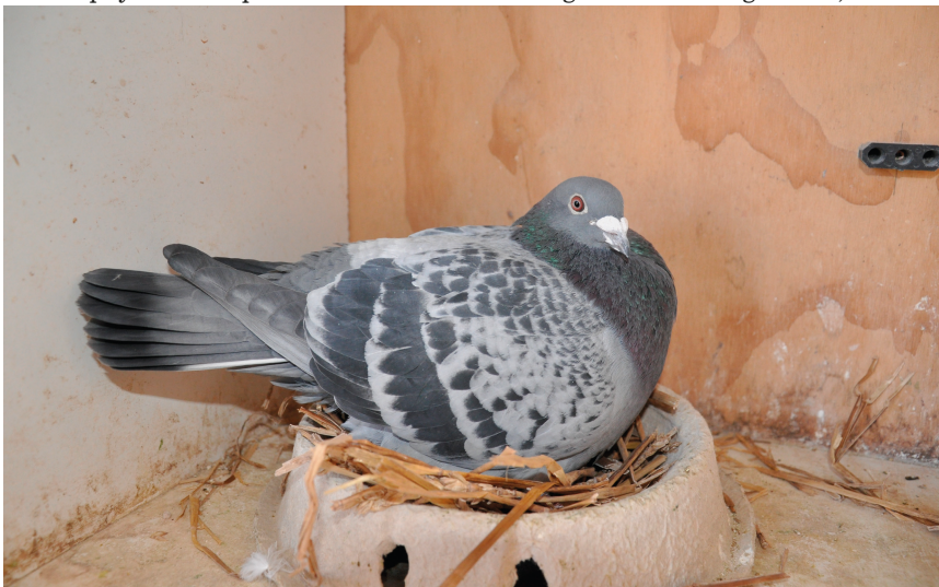
DAN 156-03-308 Super avlshun