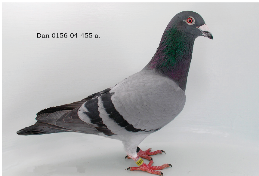
DAN156-04-455 Super avlshan