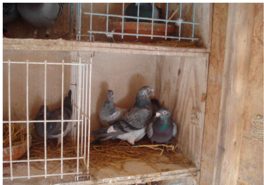
Superavlsparret med afkom