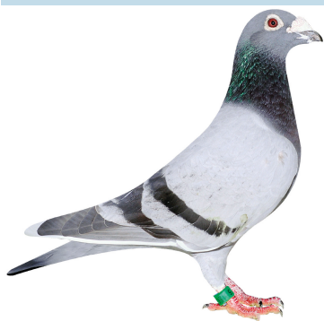
Klasse 1 Brian Jensen 053 Sølyst 96,00 point