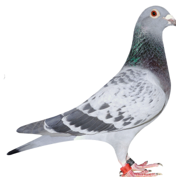
Klasse 12 Tommy Gydesen 055 Vejle 94,50 point