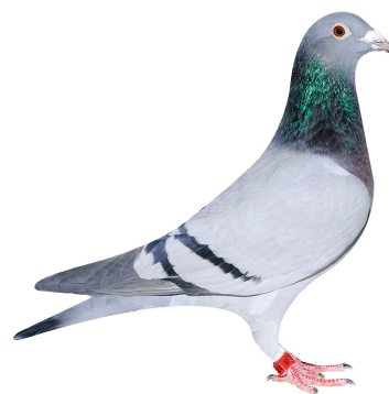
Klasse 6 Bent Thomsen-Petersen 027 Esbjerg 94,25 point