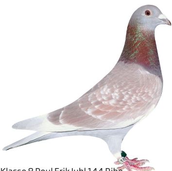
Klasse 8 Poul Erik Juhl 144 Ribe 93,75 point