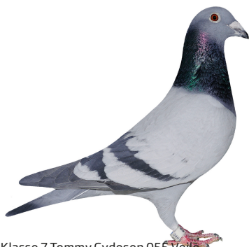
Klasse 7 Tommy Gydesen 055 Vejle 94,00 point