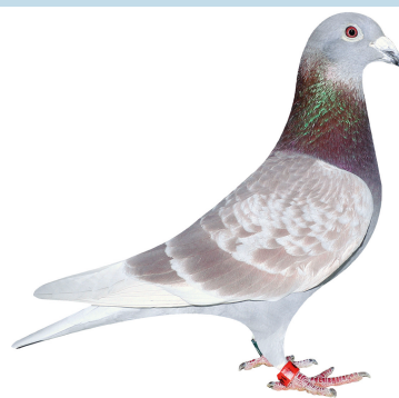
Klasse 3 Poul Erik Juhl 144 Ribe 94,50 point