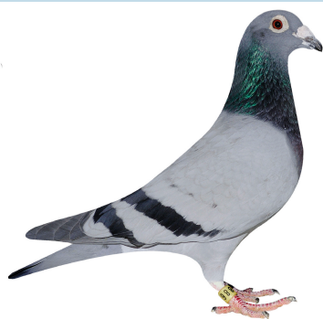
Klasse 2 I. & J., Kristensen 126 Løgstør 95,75 point