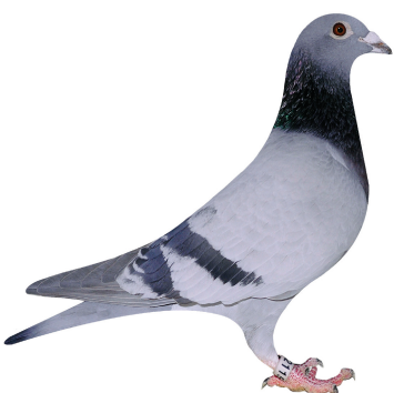
Klasse 10 I & J. Kristensen 126 Løgstør 94,25 point