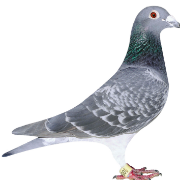
Klasse 11 Johs. Marcussen 055 Vejle 94,75 point