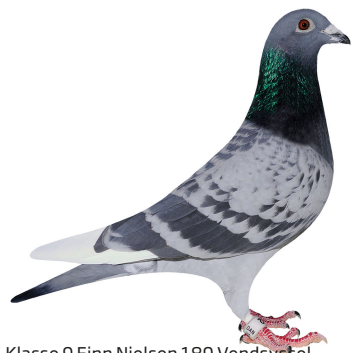
Klasse 9 Finn Nielsen 189 Vendsyssel 94,25 point