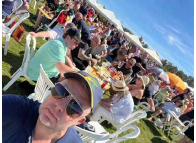
Tilskuere nyder solen

Betingelserne var, som man ønsker sig for en finale. Ungerne måtte nå deres hjemmebase ved hjælp af deres egen styrke og talent under smukke forhold, en fremragende forberedelse. Ideelt