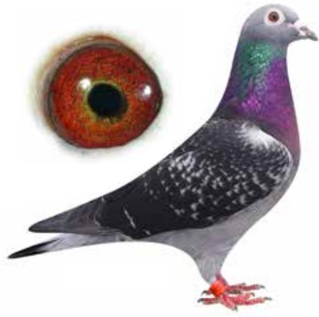
211-16-501: Moder til Nationalvinder Karlsruhe 2020

Det totale system praktiseres ganske traditionelt med parring af