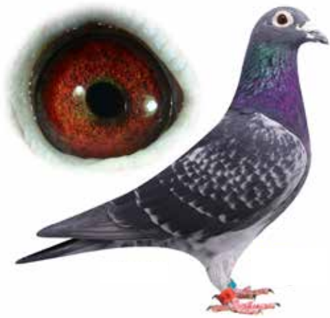
211-11-867: Bedstemoder til Nationalvinder Karlsruhe 2020