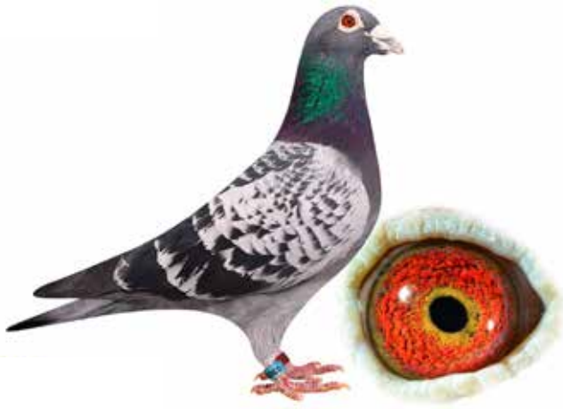
028-10-308: Fader til Nationalvinder Karlsruhe 2020