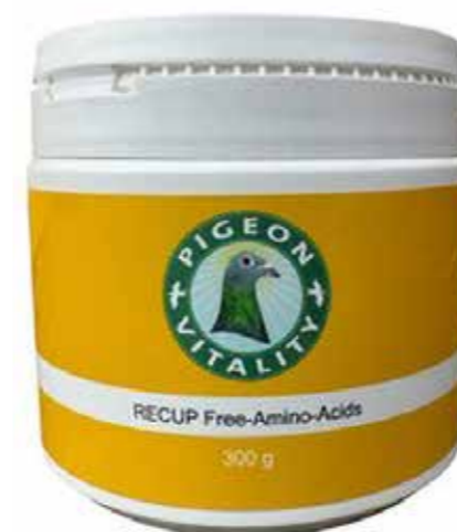
RECUP Free-Amino-Acids 300 gr

Kommentar: Team Krogen konkurrerer haner på sprint og mellemafstand og hunner på lang afstand og maraton.