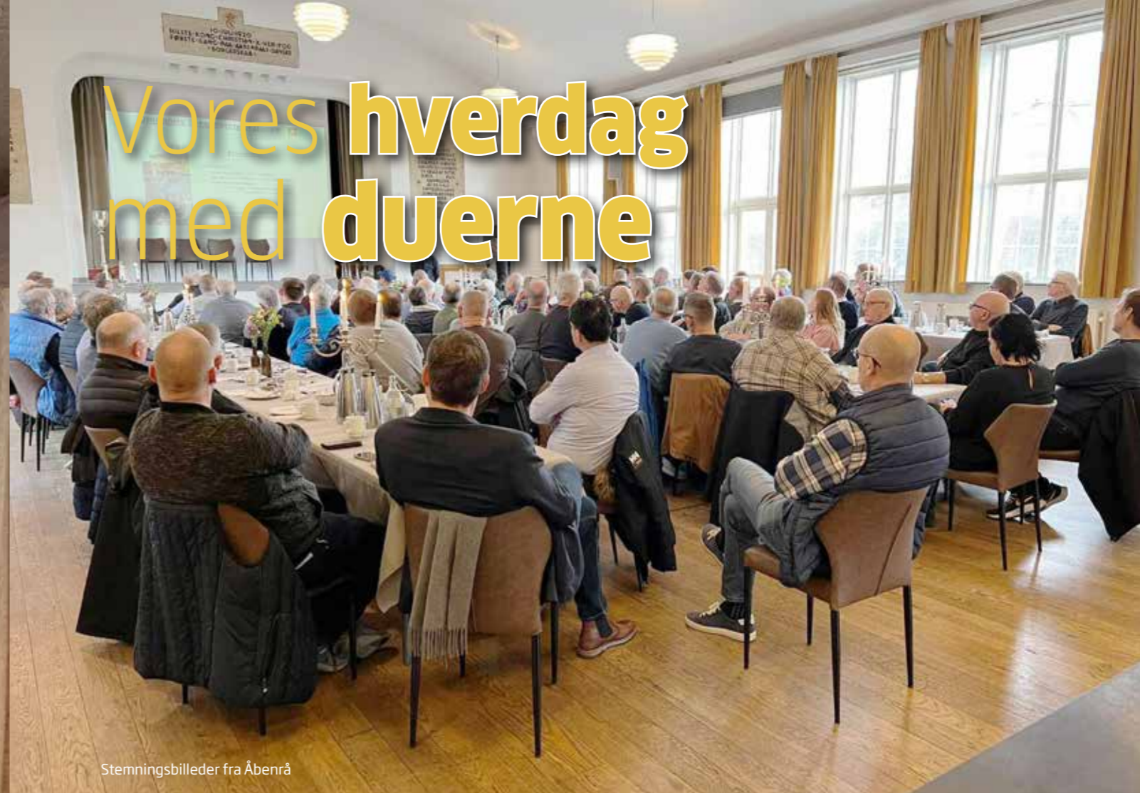
Stemningsbilleder fra Åbenrå