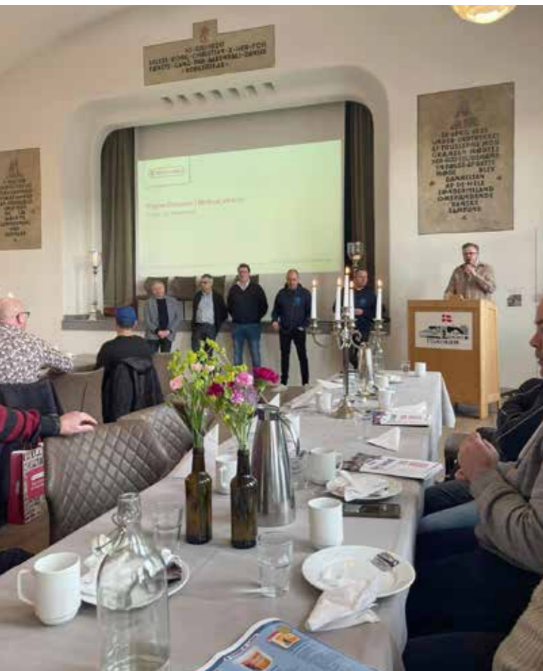
Stemningsbilleder fra Åbenrå

flyver en time hjemme om slaget. Dette er et krav til duerne og kurvetræningen starter heller ikke før vi er tilfredse med træningen hjemme om slaget.